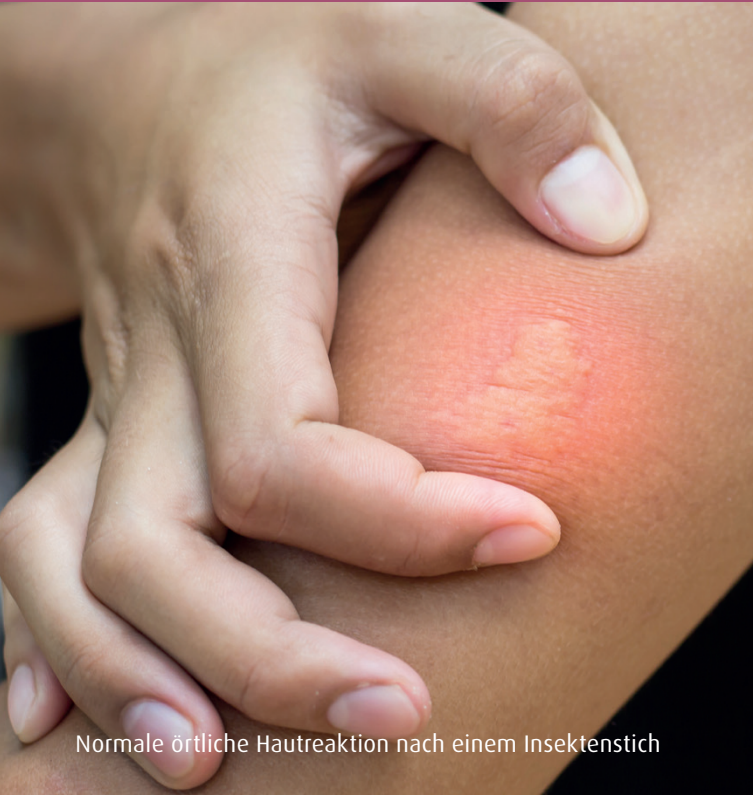
Normale örtliche Hautreaktion nach einem Insektenstich

Etwa 1 bis 3% der Menschen reagieren allergisch auf das Gift bestimmter Insekten. In Deutschland gehören hierzu Bienen, Wespen, Hummeln und Hornissen. Bienen und Wespen haben hierbei aufgrund der weiten Verbreitung und der Nähe zum Menschen die größte Bedeutung.